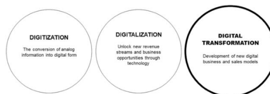
Gambar 1. Tiga Era Transformasi Digital dalam Penjualan

Transformasi digital yang di maksud bukanlah hanya mengubah alat teknologinya, akan tetapi harus menyesuaikan dengan pelanggan dimana perubahan pendekatan juga diperlukan supaya dapat memenuhi keinginan pelanggan itu, perbedaan dari 3 istilah tersebut dapat dilihat di Gambar 1. Maka, Transformasi digital dalam penjualan adalah sebuah proses yang didukung oleh sarana teknologi untuk menciptakan model dan pendekatan penjualan baru atau dimodifikasi, pengalaman pelanggan, dan proses penjualan yang memenuhi persyaratan pasar dan pelanggan yang berubah. (Rainsberger, 2023)