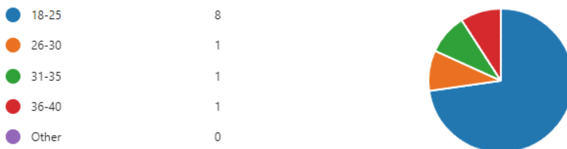
Gambar 4. Usia Responden