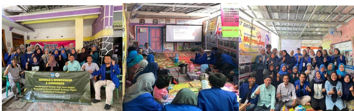
Gambar 3. Pelatihan Dan Pendampingan Memiliki Akun/Toko Melalui E-commerce Shopee

Dalam pelatihan dan pendampingan ini diawali dengan pengenalan Shopee sebagai salah satu e-commerce terbesar di Indonesia. Kemudian dijelaskan pula keuntungan dan kelebihan dengan memiliki akun atau toko di Shopee yaitu brand awareness yang tinggi di Indonesia sehingga calon konsumen menjadi lebih tinggi pula untuk dapat membeli produk UMKM.