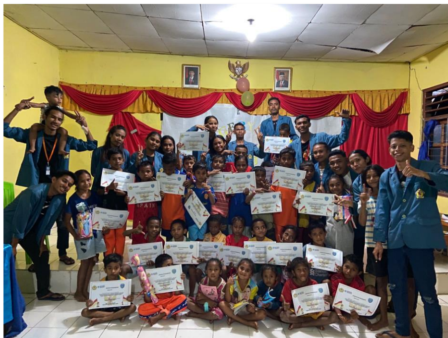
Gambar 4. Penutupan Kegiatan Amancalistung

Diakhir kegiatan bimbingan belajar Tim melakukan evaluasi progres perkembangan pengetahuan peserta bimbingan belajar dengan mengadakan lomba Gebyar Amancalistung. Kegiatan Gebyar Amancalistung dilaksanakan pada tanggal 16 Agustus di Aula Kantor Kelurahan Sasi. Selain sebagai bahan evaluasi kegiatan ini juga dilakukan sebagai salah satu lomba untuk memeriahkan ulang tahun Republik Indonesia. Gebyar Amancalistung dikemas dengan membagi peserta ke dalam dua kelompok yaitu kelas 1 dalam kelompok tersendiri, sedangkan kelas 2 dalam satu kelompok. Materi lomba disesuaikan dengan materi-materi yang telah didapat saat bimbingan belajar. Selain memberikan hadiah bagi peserta yang juara, panitia juga membagikan sertifikat sebagai bentuk apresiasi semangat belajar kepada semua peserta yang telah mengikuti bimbingan belajar (Gambar 4).