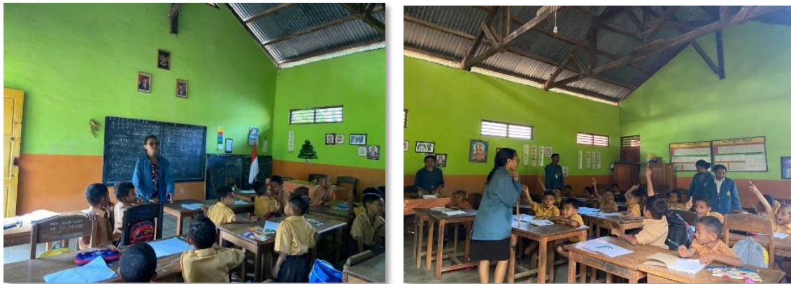
Gambar 2. Kegiatan Bimbingan Belajar di SD Negeri 1 Sasi

Diakhir kegiatan bimbingan belajar Tim melakukan evaluasi progres perkembangan pengetahuan peserta bimbingan belajar dengan mengadakan lomba Gebyar Amancalistung. Kegiatan Gebyar Amancalistung dilaksanakan pada tanggal 16 Agustus di Aula Kantor Kelurahan Sasi. Selain sebagai bahan evaluasi kegiatan ini juga dilakukan sebagai salah satu lomba untuk memeriahkan ulang tahun Republik Indonesia. Gebyar Amancalistung dikemas dengan membagi peserta ke dalam dua kelompok yaitu kelas 1 dalam kelompok tersendiri, sedangkan kelas 2 dalam satu kelompok. Materi lomba disesuaikan dengan materi-materi yang telah didapat saat bimbingan belajar. Selain memberikan hadiah bagi peserta yang juara, panitia juga membagikan sertifikat sebagai bentuk apresiasi semangat belajar kepada semua peserta yang telah mengikuti bimbingan belajar (Gambar 4).