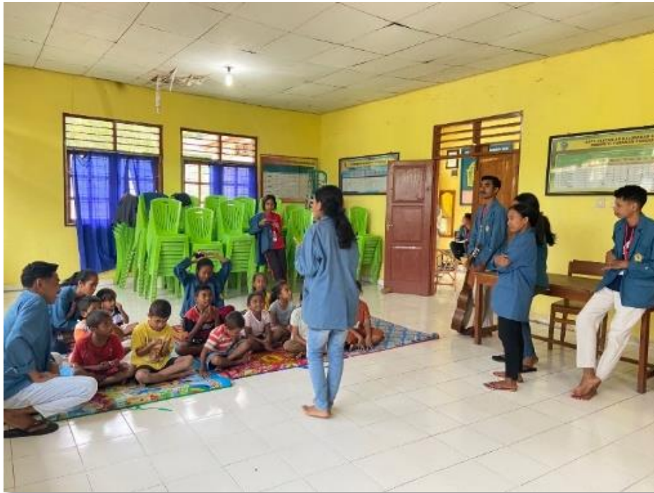
Gambar 1. Pelaksanaan Bimbingan Belajar Minggu Pertama

Kegiatan bimbingan belajar minggu ke-2 berlangsung di SD Negeri Sasi. Kegiatan bimbingan belajar di sekolah dilaksanakan selama 30 menit setelah apel pagi selesai. Bimbingan belajar di sekolah dibatasi hanya pada kelas 1 dan 2. Materi yang diberikan berupa menyimpulkan kosakata mengenai berbagai benda yang ada di sekitar melalui suatu teks pendek. Kegiatan bimbingan ini kemas dengan bentuk nyanyian dan fun games . Siswa diminta untuk melengkapi huruf-huruf yang hilang dari teks pendek. Di hari terakhir siswa juga diajak bernyanyi sebuah teks lagu dan melengkapi huruf serta kata-kata yang hilang dari teks tersebut. Pada saat pelaksanaan kegiatan siswa terlihat sangat antusias mengikuti proses pembelajaran. Setiap siswa berlomba-lomba untuk dapat melengkapi setiap huruf atau kata dari teks singkat maupun teks lagu yang ada. Penerapan metode fun learning untuk meningkatkan minat belajar siswa juga telah dilakukan sebelumnya oleh beberapa Tim KKN (Alwahidi et al., 2021; Boyani et al., 2022) sebagai bentuk dari salah satu program KKN yang dilaksanakan di Desa Sengkerang dan Desa Bolok dan hasilnya menunjukkan bahwa adanya peningkatan semangat belajar dari siswa.