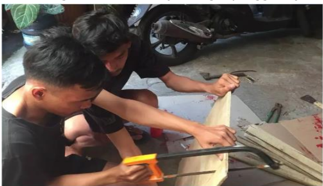
Gambar 6. Penyediaan Papan Jalan di Dusun Hanjuang Bereum

Program ini dilaksanakan pada minggu ke-2 dan ke-5. Dalam Program ini, target sasaran adalah jalan di Dusun Hanjuang Beureum, Desa Alamendah, Kecamatan Rancabali Kabupaten Bandung. Program Penyediaan Papan Jalan ini bertujuan untuk memudahkan para pengguna jalan khususnya yang bertamu ke Dusun Hanjuang Bereum. Papan petunjuk arah jalan dusun merupakan prasarana untuk memperjelas arah menuju dusun yang akan dilewati oleh pengguna jalan (Narmada et al., 2022). Selain papan jalan, diperlukan juga pengadaan papan denah lokasi penunjuk arah ke tempat-tempat penting serta papan himbauan area bebas sampah dan himbauan lubang atau kerusakan jalan agar pengguna jalan khususnya pengguna kendaraan.