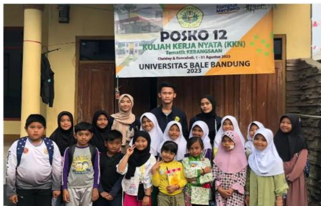
Gambar 2. Bimbel Bahasa Inggris