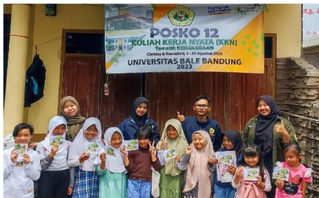
Gambar 3. Bimbel Literasi Numerasi Permulaan