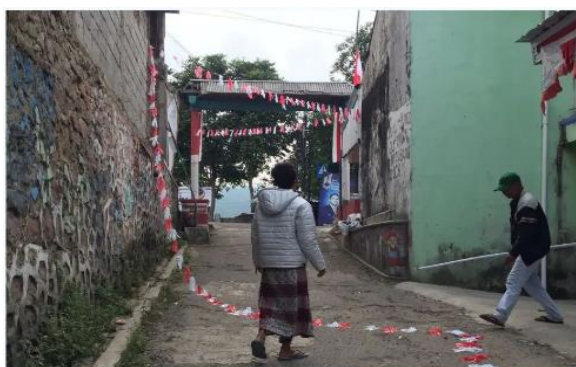
Gambar 10. Persiapan Agustusan di Dusun Hanjuang Beureum