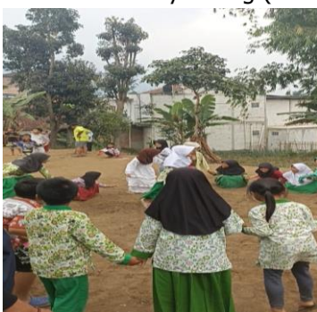
Gambar 11. Kaulinan Barudak

Program ini dilaksanakan pada Minggu Ke-1, Minggu Ke-2, Minggu Ke-3 pelaksanaan program-program KKN. Dalam Program ini target sarasannya adalah Anak-anak di Dusun Hanjuang Beureum Desa Alamendah Kecamatan Rancabali Kabupaten Bandung. Program Kaulinan Barudak ini Bertujuan untuk menjaga kelestarian budaya kaulinan barudak Sunda. Melalui kearifan lokal dan nilai-nilai didaktis dalam Program Kaulinan Barudak diharapkan dapat membentuk generasi muda yang berakhlak mulia ketika dewasa nanti (Taufik, 2022). Generasi muda sebagai harapan dalam mempertahankan eksistensi kearifan lokal, saat ini perlu mendapat perhatian agar kembali tertanam kemauan untuk mempertahankan nilai-nilai kearifan local, sehingga tidak hilang dan tergantikan oleh budaya asing (Faiz et al., 2020).