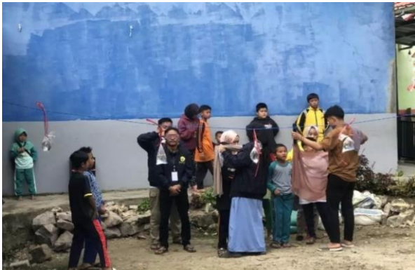
Gambar 8. Salah Satu Perlombaan Agustusan

Program ini dilaksanakan pada Minggu Ke-3, Minggu Ke-4, dan Minggu Ke-5 (17-22 Agustus 2023). Dalam Program ini, target sasarannya adalah masyarakat Desa Alamendah, Kecamatan Rancabali, Kabupaten Bandung. Program Gebyar Kemerdekaan ini bertujuan untuk memupuk rasa cinta tanah air. Hal ini sangat sejalan dengan KKN Tematik Kebangsaan. Salah satu wadah untuk menumbuhkan rasa cinta tanah air, rasa solidaritas antar sesama, menumbuhkan semangat membangun bangsa Indonesia adalah dengan melalui perayaan hari kemerdekaan yang tiap tahun dilaksanakan pada tanggal 17 Agustus. Diharapkan melalui momen kemerdekaan ini dapat membakar semangat generasi muda melalui berbagai lomba yang telah ditentukan sebelumnya. Dan mengajarkan arti penting sebuah kemerdekaan dan betapa susahnyanya para pahlawan terdahulu dalam merebut kemerdekaan serta menghargai sejarah (Aldo et al., 2022).