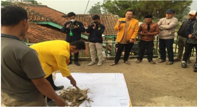
Gambar 7. Lokakarya Praktik Cara Pembuatan Pupuk dari Olahan sampah Organik

Masyarakat diharapkan mampu memilah sampah anorganik dan organik. Masyarakat mampu melakukan pengolahan sampah organik untuk diolah menjadi pupuk. Dengan demikian diharapkan debit sampah yang dihasilkan untuk dibuang ke tempat pembuangan akhir sampah dapat berkurang (Hartawan & Prasandya, 2023).