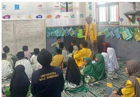
Gambar 1. Gerakan Mengajar Desa

Kegiatan mengajar juga dilakukan dalam bentuk les (bimbingan belajar/bimbel). Hal tersebut dipilih karena bimbingan belajar membuat anak-anak menjadi senang, bersemangat dan termotivasi karena mereka dapat belajar dan mengerjakan tugas secara bersama-sama dengan bimbingan dari mahasiswa (Amelia, 2021).