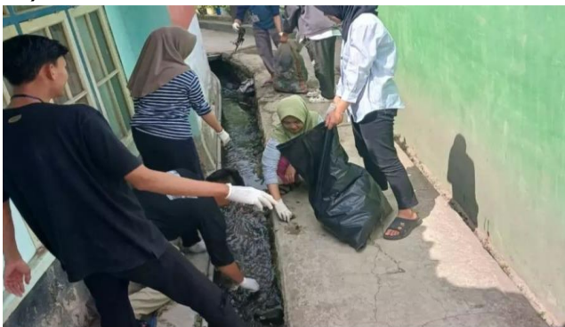
Gambar 5. Jumat Bersih (Jumsih)

Program ini dilaksanakan pada minggu ke-1, ke-2, dan minggu ke-3. Dalam program ini, target sasaran adalah masyarakat di Dusun Hanjuang Beureum, Desa Alamendah, Kecamatan Rancabali, Kabupaten Bandung. Program Jumat Bersih (Jumsih) ini bertujuan untuk menumbuhkan rasa gotong royong masyarakat Hanjuang Beureum RW 14. Melalui partisipasi aktif dalam kegiatan ini, masyarakat menjadi tangguh, bertanggung jawab, dan peduli terhadap lingkungan (Maulana et al., 2023).