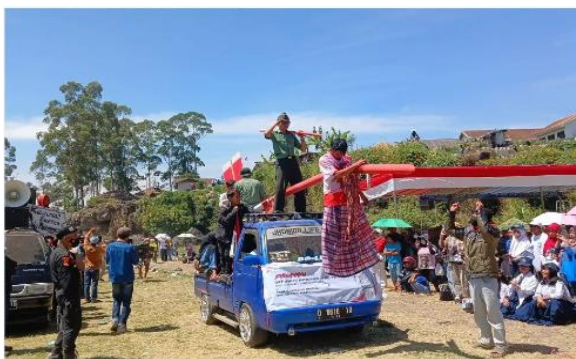
Gambar 9. Kegiatan Arak-Arakan Agustusan di Desa Alamendah