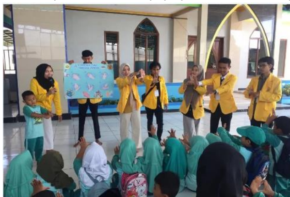
Gambar 4. Penyuluhan Kesehatan dan PHBS

Program ini dilaksanakan pada minggu kedua. Dalam Program ini, target sasarannya adalah anak-anak PAUD di Dusun Hanjuang Beureum, Desa Alamendah, Kecamatan Rancabali, Kabupaten Bandung dengan jumlah siswa 87. Program Penyuluhan Kesehatan dan Perilaku Hidup bersih dan Sehat ini Bertujuan Untuk mengedukasi anak-anak PAUD Qurata A'yun pentingnya perilaku hidup sehat. Pembiasaan hidup bersih dan sehat sangat penting untuk semua usia mulai dari neonatus hingga lansia. Semakin dini pembiasaan hidup sehat dilakukan, semakin tinggi pula derajat kesehatan masyarakat karena upaya preventif tersebut (Prayogo et al., 2022).