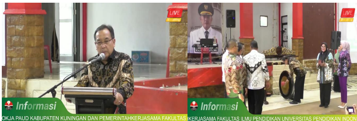
Gambar 2. Pembukaan kegiatan P2M Oleh Rektor UPI dan Wabup Kab. Kuningan