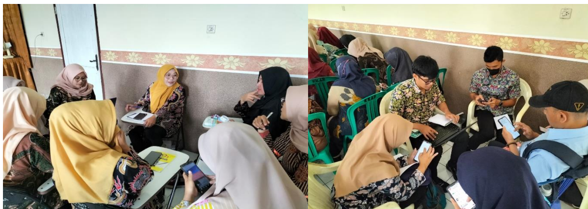
Gambar 3. Kegiatan Praktik Pelatihan Penyusunan Instrumen Assesment Kurikulum Merdeka