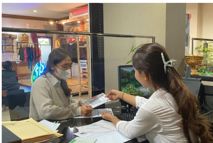
Gambar 2. Penjelasan Mengenai Sistem Penggunaan QRIS

Dalam pengisian formulir QRIS nasabah UMKM harus menggunakan persyaratan seperti fotocopy KTP, Kartu Keluarga, dan NPWP. Namun, pengumpulan fotocopy NPWP tidak diwajibkan, nasabah dapat mengumpulkan NPWP jika memiliki NPWP. Jika tidak memiliki NPWP nasabah UMKM dapat mengisi formulir NPWP. Dalam melakukan pengisian formulir tersebut, nasabah UMKM dapat mengikuti permintaan yang ada di formulir tersebut, seperti pengisian nama, nomor telepon, nama usaha, Alamat usaha, omset perbulan, harga produk termudah, harga produk termahal, dan lain sebagainya. Hal tersebut harus dilakukan sebelum pembuatan Code QR . Setelah pengisian formulir QRIS tersebut, pembuatan Code QRIS akan di proses.