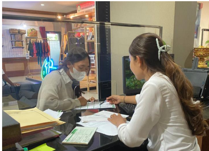
Gambar 1. Penjelasan Mengenai Pengisian Formulir QRIS

system pembayaran QRIS . Untuk mengatasi masalah yang ada, terdapat beberapa kegiatan yang dapat dilakukan, yaitu :