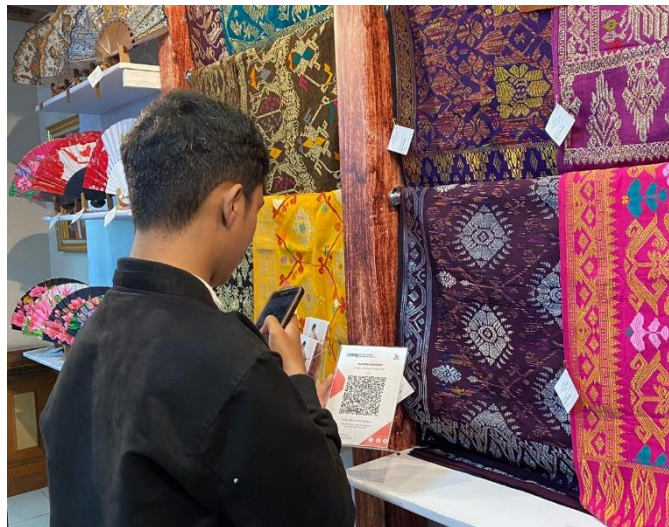
Gambar 3. Penggunaan pembayaran QRIS oleh konsumen

Sebelum memberikan code QRIS nya, perlu dilakukan penjelasan mengenai penggunaan system QRIS tersebut. Bahwa dalam code QRIS tersebut sudah terdapat nama usaha nasabah dan nomor NMIDnya. Dalam penjelasan mengenai penggunaan system QRIS ini, nasabah UMKM perlu memahami jalannya transaksi yang akan terjadi, dimana dalam melakukan penjualan dan melakukan transaksi melalui QRIS , laporan transaksi tersebut akan bisa masuk di hari kerja Bank yaitu hari senin sampai jumat. Namun, apabila transaksi tersebut dilakukan pada hari sabtu dan minggu, laporan transaksi tersebut belum masuk, namun laporan transaksi yang dilakukan pada hari sabtu dan minggu akan masuk di hari senin. Selain itu, dalam melakukan pembayaran melalui QRIS nasabah UMKM harus mempunyai Mobile Banking Bank BPD Bali agar dapat menggunakan pembayaran melalui QRIS . Dimana, melalui Mobile Banking ini dapat melakukan pengecekan apakah laporan transaksi sudah masuk apa belum.