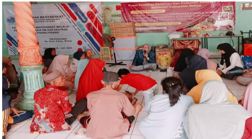
Gambar 3. Kegiatan Penyuluhan Kesehatan

Berikut gambar yang memperlihatkan kegiatan perawatan luka Diabetes Melitus dengan menggunakan ekstrak daun pisang di Desa Setiadharma Tambun.