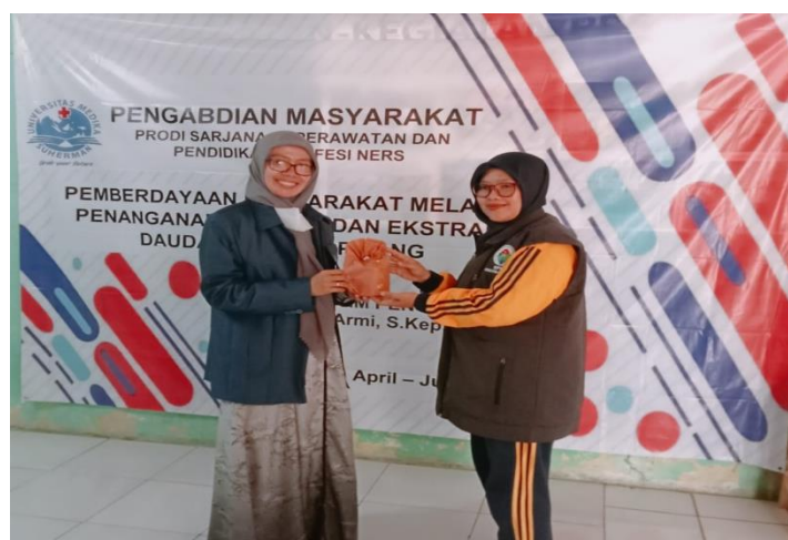
Gambar 4. Serah Terima Bingkisan Buat Kader