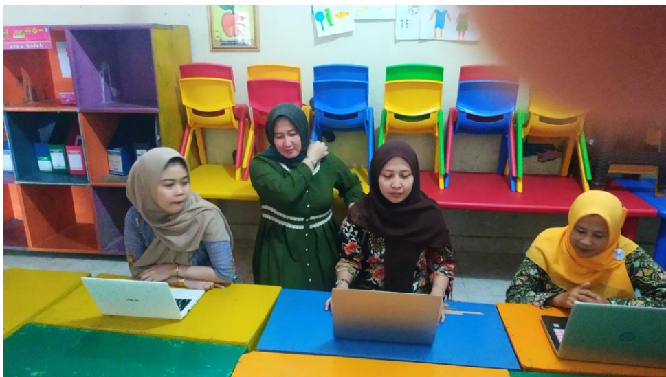
Gambar 2. Kegiatan Pegabdian

Dalam hasil evaluasi secara kualitatif, setelah dilakukan kegiatan pengabdian, para guru memberikan informasi bahwa anak-anak menunjukkan tingkat keterlibatan yang lebih tinggi dalam pembelajaran ketika menggunakan presentasi yang disiapkan dengan powerpoint dan aplikasi canva. Mereka lebih antusias untuk belajar dan lebih fokus pada materi yang disajikan dengan cara yang menarik dan visual.