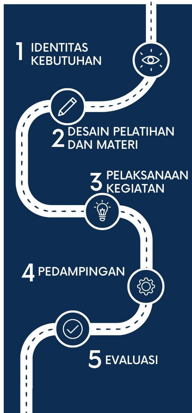
Gambar 1. Diagram Kegiatan