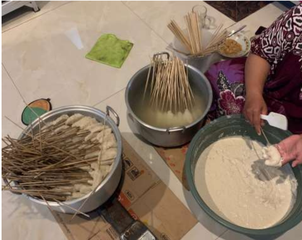
Gambar 1. Produk dan proses pembuatan SEMPOL SULTAN

Sementara kebanyakan pelaku usaha makanan ringan masih mempertahankan system penjualan secara offline / tradisional dikarenakan minimalnya pengetahuan dalam hal IT. Oleh karena ini kegiatan pengabdian ini akan memberikan pengetahuan bagi pelaku usaha untuk bisa secara mandiri dalam membuat logo, poster, banner, serta akun media sosial. Sehingga dengan penerapan startegi pemasaran tersebut dapat menaikkan omset penjualan.