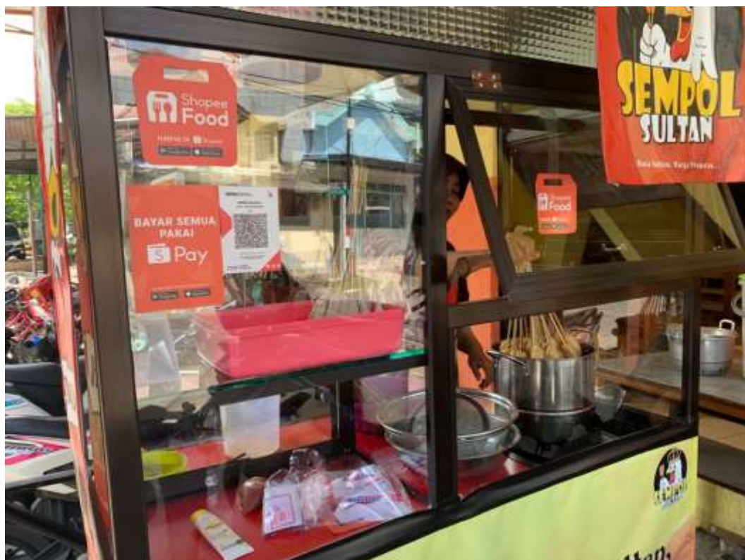
Gambar 7. Hasil kegiatan berupa stiker (lokasi cabang 2)