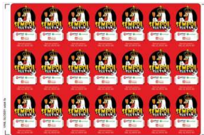
Gambar 3. Hasil kegiatan berupa stiker yang akan ditempel pada packaging produk