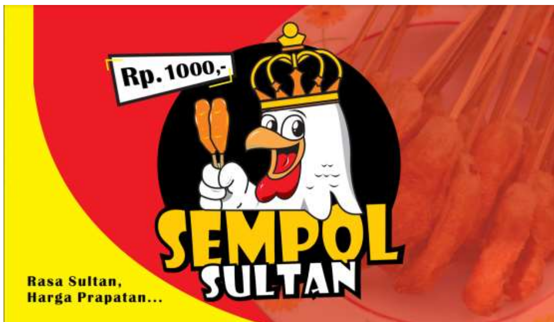
Gambar 5. Hasil kegiatan yaitu berupa desain banner

Setelah proses pembuatan desain grafis telah selesai, maka Langkah selanjutnya adalah proses percetakan dan dilanjutkan dengan pemasangan di lokasi usaha mitra. Gambar 6 dan 7 menunjukkan beberapa stiker yang sudah terpasang di dua cabang SEMPOL SULTAN.