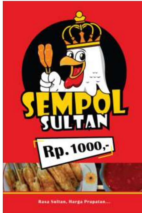
Gambar 4. Hasil kegiatan yaitu berupa desain poster

Untuk stiker packaging produk dicetak menggunakan kertas stiker Vinyl Glossy dikarenakan jenis kertas ini lebih tahan air. Sehingga lebih awet ketika ditempelkan ke packaging produk SEMPOL SULTAN. Untuk 1 lembar kertas A3+ akan mendapatkan 21 pcs stiker, ukuran ini telah disesuaikan dengan ukuran dari packaging (tidak terlalu besar atau tidak terlalu kecil).