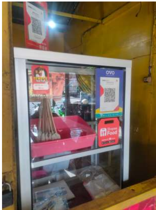
Gambar 6. Hasil kegiatan berupa stiker (lokasi cabang 1)