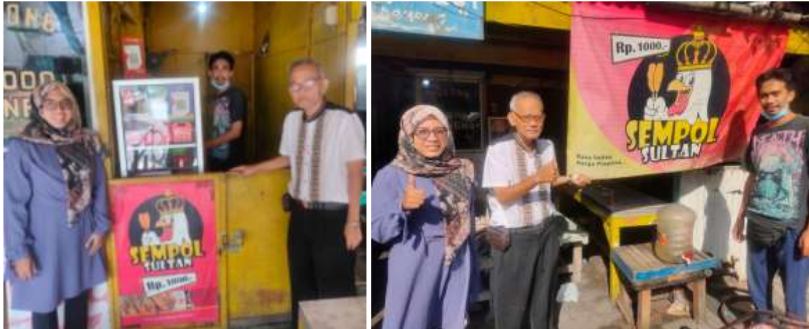
Gambar 8. Hasil kegiatan berupa poster dan banner SEMPOL SULTAN

Terlihat bahwa lokasi usaha mitra lebih menarik pengunjung dan nilai branding lebih baik ketika hasil desain grafis telah terpasang dari pada sebelumnya. Cara pembayaran yang bisa dilakukan lebih terdefinisi dengan jelas dengan pemasangan stiker-stiker tersebut. Masyarakat disekitar lokasi juga lebih menyadari akan adanya usaha SMEPOL SULTAN dibandingkan sebelum pemasangan banner.