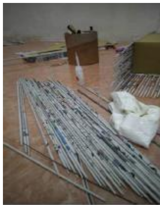
Gambar 1. Linting Koran