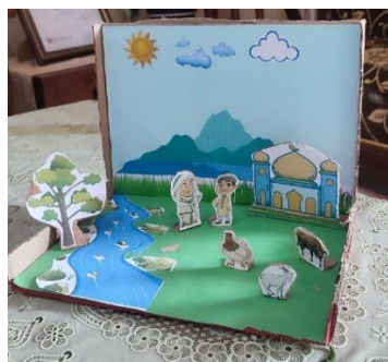
Gambar 2. Media Diorama

Dilakukan uji anava model pembelajaran Project Based Learning (PjBL) dengan media diorama mengoptimalkan keterampilan berbicara dan menulis karangan narasi siswa kelas V Sekolah Dasar. Hal pertama yang dilaksanakan ialah melakukan kegiatan untuk memastikan apakah data tersebar merata dan homogen, dilakukan uji normalitas dan homogenitas. Selanjutnya, selepas uji prasyarat terpenuhi dilakukan uji anova. Temuan analisis data berikut dibuat: