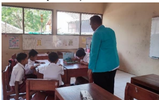
Gambar 1. Pelaksanaan Pembelajaran

Berdasarkan pengamatan selama tindakan penelitian yang dilakukan dalam 3 pertemuan dapat diketahui terdapat perubahan dibandingkan sebelum diberikan Tindakan. Sebelum Tindakan pada pertemuan pertama lembar kerja peserta didik (LKPD) pretest peserta didik digarap untuk menentukan keterampilan dasar dalam keterampilan berbicara dan menulis karangan narasi. Pada pertemuan kedua peserta didik semakin menunjukkan antusias yang tinggi dalam mengikuti kegiatan belajar. Pada pertemuan ketiga Lembar Kerja diselesaikan oleh siswa atau LKPD. Posttest untuk mengetahui efektifitas model pembelajaran yang terjadi ketika saat pembelajaran.