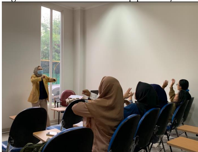
Gambar 2. Mahasiswa membuka pembelajaran dengan melakukan gerakan

ada melupakan melakukan kegiatan pembelajaran dan hanya melakukan salam penutup saja. Komponen dalam kegiatan menutup dengan meninjau kembali pembelajaran yang telah dilakukan mendapat presentasi 67% sedangkan melakukan penilaian atau evaluasi terhadap pembelajaran hanya dilakukan oleh 4 orang mahasiswa saja sehingga memperoleh 44%. Mengorganisasikan kegiatan serta mengadakan konsolidasi terkait pembelajaran memperoleh masing-masing presentase sebesar 56%. Kegiatan menyimpulkan memperoleh 100% yang artinya semua mahasiswa telah melakukan kegiatan menyimpulkan pembelajaran yang telah dilaksanakan, sedangkan hanya 33% saja tindak lanjut yang dilakukan mengidikasikan hanya beberapa mahasiswa saja yang melakukan tindakan lanjut setelah proses pembelajaran. Secara garis besar keterampilan dasar membuka dan menutup telah dilaksanakan dengan baik. Hal ini terlihat dari perolehan rata-rata setiap komponen yang dilakukan oleh mahasiswa dalam melakukan kegiatan membuka dan menutup pembelajaran sebesar 69%.