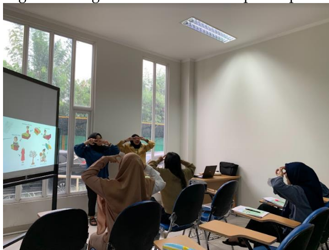
Gambar 5. Mahasiswa melakukan variasi pembelajaran dengan kegiatan bermain

melakukan kegiatan pembelajaran lainnya. Begitupula dengan ekspresi yang diberikan masih sangat terbatas dan kaku. Hal tersebut disebabkan mahasiswa merasa tegang dalam melakukan praktik microteaching . Variasi yang terjadi pada pola interaksi sesuai dengan tabel 6 diatas adalah sempurna dilaksanakan. Mahasiswa menerapkan berbagai bentuk interaksi yang terjadi baik antara guru dan peserta didik maupun antar peserta didik dari berupa kegiatan yang dilakukan secara klasikal, kelompok maupun perorangan. Hal tersebut menciptakan aktivitas pembelajaran yang beragam untuk diikuti. Berikut beberapa dokumentasi yang memperlihatkan mahasiswa melakukan kegiatan mengadakan variasi dalam proses pembelajaran.