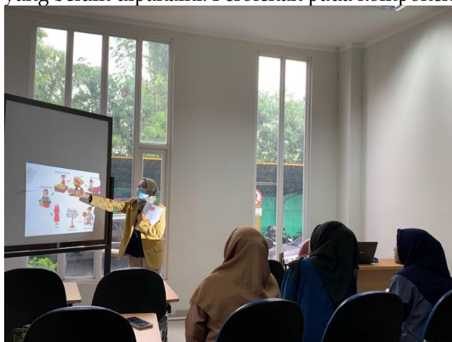
Gambar 3. Mahasiswa menjelaskan materi pembelajaran

Dalam menjelaskan diperlukan penggunaan yang mudah dipahami oleh peserta didik sehingga penggunaan bahasa yang sederhana menjadi salah komponen penting dalam keterampilan menjelaskan. Mahasiswa yang telah menggunakan bahasa sederhana dalam menjelaskan sebesar 89% saja. Komponen struktur yang jelas berarti guru praktik haruslah memiliki rancangan pembelajaran yang telah disusun sedemikian rupa agar saat menjelaskan urutan materi tidak tumpang tindih dan sesuai dengan urutan pengetahuan yang diharapkan. Tabel 4 memperlihatkan sebesar 78% mahasiswa telah memiliki struktur yang jelas dalam menjelaskan. Sedangkan dalam mengadakan latihan pada penjelasan materi sebagai penguatan materi dan mengetahui ketercapaian materi yang disampaikan hanya 22% saja. Mahasiswa memfokuskan penekanan pada materi penting daripada mengadakan latihan. Ini terlihat dari perolehan komponen penekanan materi penting sebesar 78%. Selain menjelaskan diperlukan juga adanya pertanyaan yang diberikan kepada peserta didik sehingga guru praktik dapat mengetahui tingkat pemahaman peserta didik terhadap materi yang telah disampaikan dan juga terkait materi yang belum dipahami. Perolehan pada komponen ini adalah sebesar 89%.