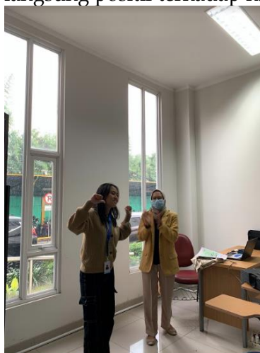
Gambar 7. Mahasiswa memberikan penguatan kepada peserta didik yang berani untuk maju ke depan

Penguatan yang bersifat verbal sebanyak 80% diberikan oleh mahasiswa dalam bentuk kata pujian seperti hebat, bagus, pintar, luar biasa, dan mantab. Pada gambar 7 terlihat guru memberikan penguatan kepada peserta didik yang berani tampil ke depan kelas dengan memberikan tepuk tangan dan nyanyian apresiasi kepada peserta didik. Kegiatan ini memotivasi peserta didik lainnya untuk berani tampil di depan kelas. Keterampilan guru dalam memberikan penguatan dan keterampilan menjelaskan berpengaruh langsung positif terhadap hasil belajar (Minarni, 2017)