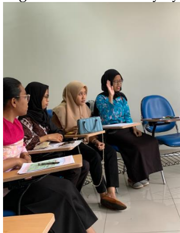
Gambar 4. Peserta didik menjawab pertanyaan guru praktik (mahasiswa)

Berdasarkan tabel 5 hasil observasi diatas, diperoleh rata-rata implementasi keterampilan bertanya mahasiswa adalah 66% dengan kategori tinggi. Ini menunjukkan bahwa dalam implementasi keterampilan bertanya mahasiswa pgsd telah dapat mampu mengungkapkan pertanyaan secara jelas dan singkat (70%), memberikan acuan kepada peserta didik agar dapat menjawab dengan tepat (60%), melakukan pemindahan giliran menjawab (80%) dan menyebarkan pertanyaan kepada peserta didik secara acak (70%). Sedangkan dalam pemberian waktu untuk menjawab dan berpikir kepada peserta didik, mahasiswa yang menjadi guru praktek tidak banyak yang memberikan kesempatan tersebut (50%). Dalam menuntun peserta didik yang mengalami kesulitan menjawab dan menciptakan suasana yang hangat dalam mengajukan pertanyaan memperoleh presentasi sebesar 70% dan 60%. Kegiatan bertanya penting diperhatikan karena pertanyaan perlu tersusun dengan baik dan menggunakan teknik bertanya yang tepat agar memberikan dampak positif pada siswa (Sutisnawati, 2017). Oleh karena itu, guru perlu menguasai bagaimana cara bertanya yang efektif.