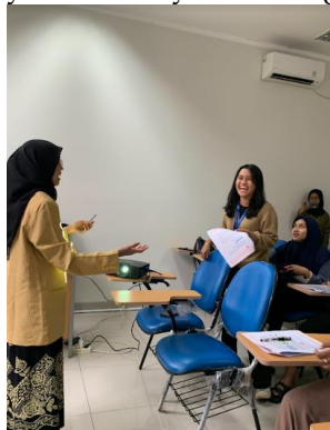
Gambar 8. Mahasiswa membimbing peserta didik dalam menyelesaikan tugas belajarnya

Hasil observasi keterampilan pada tabel 8 menunjukkan bahwa sebesar 71% mahasiswa telah mampu mengimplementasikan keterampilan dasar mengajar membimbing kelompok kecil dan perorangan. Adapun rincian setiap komponen yang menjadi indikatornya memperoleh beragam presentase ketercapaian. Diperoleh presentase sempurna pada komponen mengidentifikasi tema pembelajaran, ini terjadi karena sebelum mahasiswa melakukan kegiatan microteaching mereka telah menentukan terlebih dahulu tema yang menjadi topik kegiatan pembelajaran sehingga dalam mengembangkan bahan belajar (71%) dan pengorganisasian unsur pembelajaran (86%) juga telah dilakukan dengan sangat baik. Dalam pelaksanaan pembimbingan kelompok kecil dan perorangan sangat diperlukan kedekatan personal antara guru dan peserta didik sehingga guru dapat memberikan tindakan yang sesuai dengan karakteristik dan gaya belajar masing - masing individu maupun kelompok. Hanya 57% mahasiswa yang telah melakukan pengenalan secara personal kepada peserta didik. Hal ini berimplikasi pada bagaimana guru dapat mendorong peserta didik untuk menyelesaikan tugas belajarnya (43%). Diakhir pembimbingan guru wajib memberikan kulminasi atau kesimpulan hasil pembimbingan di akhir kegiatan yang telah dilakukan oleh 71% mahasiswa dari 74 orang yaitu sebanyak 5 orang mahasiswa.