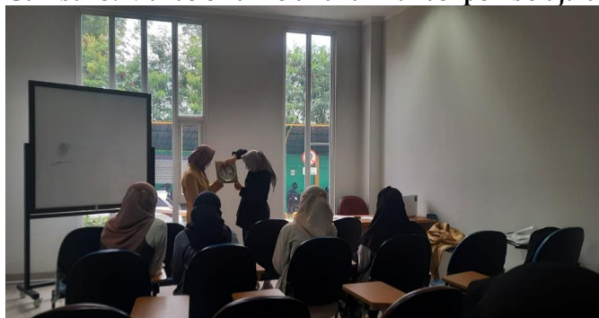
Gambar 6. Mahasiswa melibatkan peserta didik dalam penggunaan media

Pada gambar 5 dan 6 terlihat mahasiswa bersama siswa sedang melakukan berbagai kegiatan dalam pembelajaran. Gambar 5 memperlihatkan siswa bersama sedang bermain dan bernyanyi sedangkan gambar 6 memperlihatkan siswa sedang menjawab pertanyaan guru dengan melakukan praktik langsung dengan bantuan media yang dibawa oleh guru. Variasi media dan alat pembelajaran menjadi tombak utama dalam proses pembelajaran yang interaktif. Penggunaan media dan alat pembelajaran dapat meningkatkan interaksi peserta didik dalam proses pembelajaran. Siswa lebih aktif dan guru juga ikut serta aktif dan kreatif dalam mengajar. Guru juga menjadi lebih aktif dan kreatif dalam membuat media pembelajaran (Nurfadhillah et al., 2021). Diperoleh hasil yang sempurna dalam komponen ini. Setiap mahasiswa menggunakan media dan alat pembelajaran yang bervariasi diantaranya dengan menghadirkan benda konkret ke kelas, media audio-visual, bermain, dan hal lainnya.